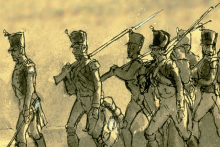
Französische Soldaten feiern im Lager bei Glogau den Geburtstag Napoleons. 15. August 1808. R. Knötel, Sammlung des Archäologisch-Historischen Museums Glogau