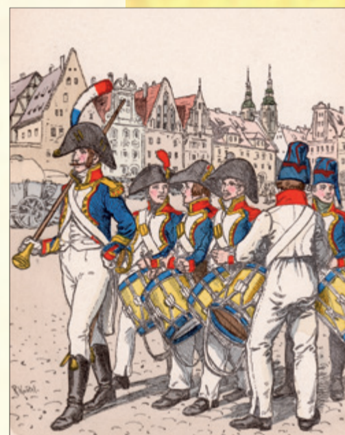
Tamburmajor i doboze, piechota liniowa, Francja. R. Knötel, Uniformkunde tom X, nr 32