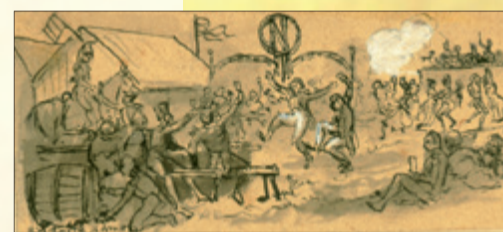
Żołnierze francuscy świętujący w podgłogowskim obozie urodziny Napoleona. 15 sierpnia 1808 r. R. Knötel, zbiory Muzeum Archeologiczno-Historycznego w Głogowie.