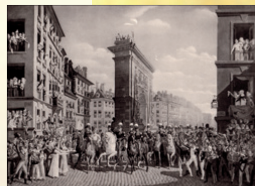
Wjazd do Paryża. Heliografia Meisenbach Riffarth & Co. Berlin. [W:] Die historische Ausstellung zur Jahrhundertfeier der Freiheitskriege Breslau 1913. Wyd. Karl Masner i Erwin Hintze. II. 83. Einzug in Paris. Heliographie Meisenbach Riffarth & Co. Berlin. Entnommen aus: Die historische Ausstellung zur Jahrhundertfeier der Freiheitskriege Breslau 1913. Hrsg. von Karl Masner und Erwin Hintze. Tafel 83.