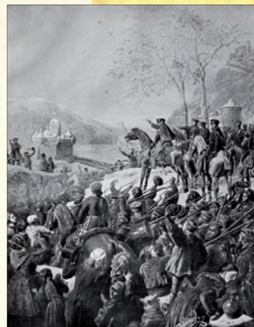
Przejście Armii Śląskiej przez Ren pod Caub 1 stycznia 1814 roku. Kopia obrazu W. Camphausena. [W:] 1813 - 1815. Illustrierte Geschichte der Befreiungskriege, Berlin 1913. Rheinübergang der Schlesischen Armee bei Caub am 1. Januar 1814. Nach dem Gemälde von W. Camphausen. Entnommen aus: 1813 - 1815. Illustrierte Geschichte der Befreiungskriege, Berlin 1913.